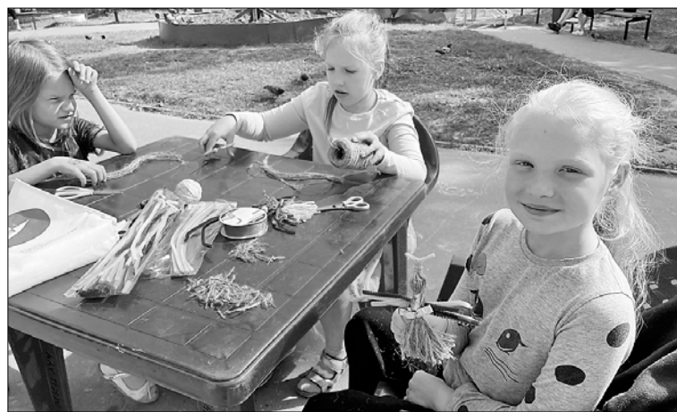
■ ФОТО: КУЛЬТУРНЫЙ ЦЕНТР «ЛУЧ»